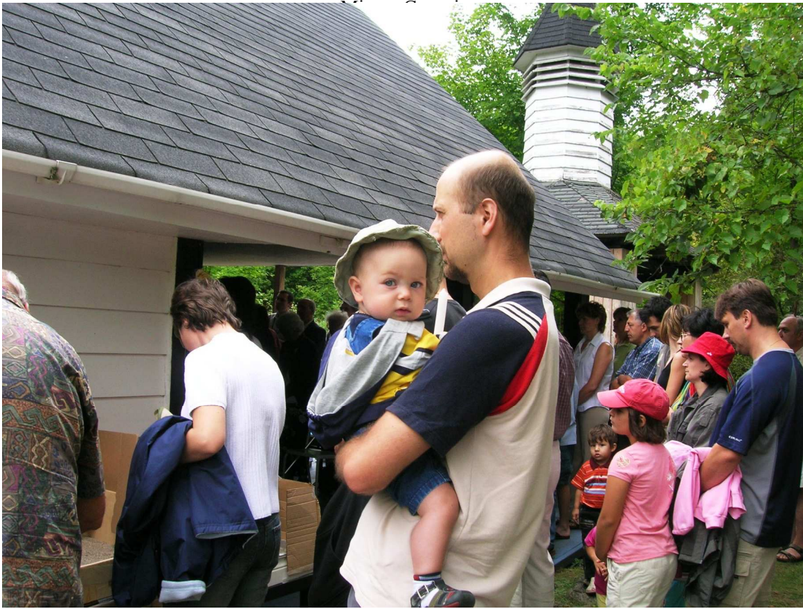
“Săptămâna Românilor”, Hamilton, Canada 20-27 august 2006 Hramul capelei “Sfânta Maria” pagina 2

Anul II nr. 19 20 pages New York – $1 Other States – $1.50