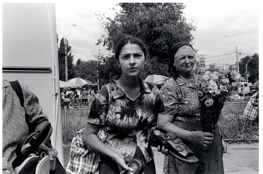
Fotografie de Peter Kayafas © – București, 2003

Sunt hoț și ca urmare am ajuns La cea mai renumită închisoare. Mi-a zis apoi acela ce m-a tuns: Fii optimist, avem cu toți... un-soare !