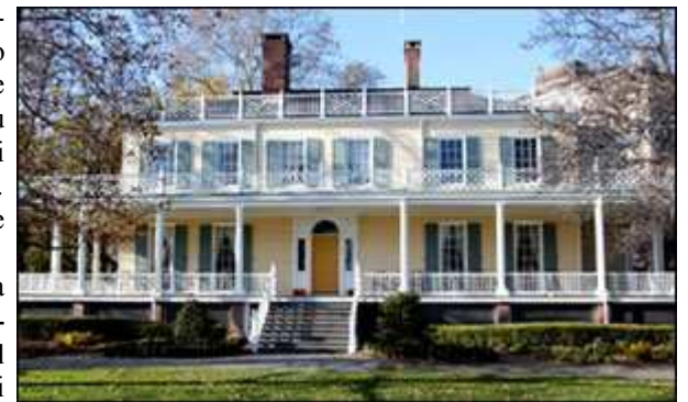
Gracie Mansion – Reședința primarilor New York-ului

Funicularul spre Roosevelt Island la strada 60, conceput în 1976, dă o notă pitorească, de turism în viața urbană.